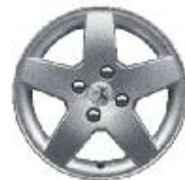
Llantas de aluminio Mónaco 15''

La información y las ilustraciones que figuran en este folleto se basan en las características técnicas vigentes en el momento de la impresión del presente documento (Marzo 2014). El equipamiento presentado en los vehículos fotografiados es de serie u opcional según las versiones. En el marco de una política de mejora constante del producto, Peugeot puede modificar sin preaviso las características técnicas, el equipamiento, las opciones y los tonos. De esta manera, este folleto constituye una información de carácter general y no un documento contractual. Para toda información complementaria, te rogamos dirigirte a tu concesionario. Fotos y equipamientos no contractuales.